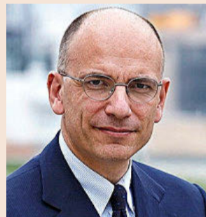
Enrico Letta Ex primer ministro de Italia