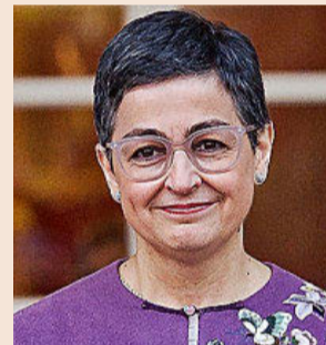
Arancha González Laya Ministra de Asuntos Exteriores