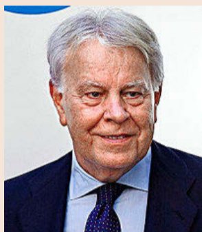
Felipe González Expresidente del Gobierno