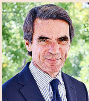
José María Aznar Expresidente del Gobierno

La I Edición del Foro Económico Internacional EXPANSIÓN contará con la participación de ponentes de primer nivel nacional e internacional que analizarán todos