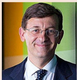
Vittorio Colao Asesor del Gobierno italiano y ex-CEO de Vodafone