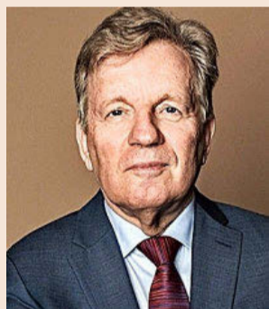
Esko Aho Ex primer ministro de Finlandia