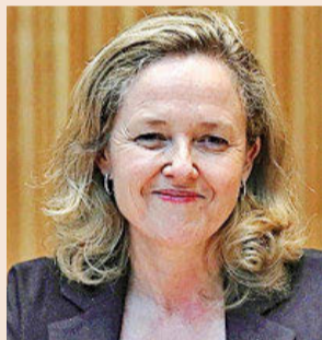
Nadia Calviño Vicepresidenta y ministra de Asuntos Económicos