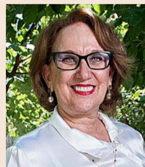
Rebeca Grynspan Secretaria General Iberoamericana