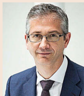
Pablo Hernández de Cos Gobernador del Banco de España